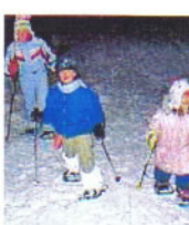
Ciaspole in Altopiano e Recoaro

guidata all'Osservatorio Astronomico di via Pennar, con conferenza in sala multimediale e osservazione delle stelle (tempo permettendo) Prenotazione obbligatoria c/o I.A.T. Altopiano di Asiago tel. 0424 462221. Ingresso 6 euro, ridotto 4. Bambini ammessi dagli 11 anni.