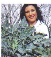
Broccolo protagonista a Creazzo

guidata all'Osservatorio Astronomico di via Pennar, con conferenza in sala multimediale e osservazione delle stelle (tempo permettendo) Prenotazione obbligatoria c/o I.A.T. Altopiano di Asiago tel. 0424 462221. Ingresso 6 euro, ridotto 4. Bambini ammessi dagli 11 anni.