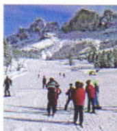
Le piste da sci per bambini