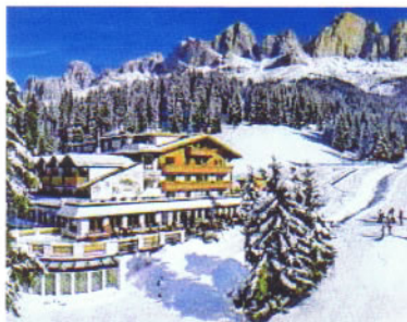
L'angolo del Moseralm, lungo via Bellavista a Carezza

Dallo scorso dicembre Carezza ha inaugurato tre nuovi impianti di risalita (la cabinovia Hubertus, la seggiovia Prà dei tori, la scioviva Pope) che portano a 40 km di piste della zona, comprese le tre belle rosse Laurin I, II e König Laurin che consentono di scendere fino a Nova Levante. Un ampio recinto-gioco per i bambini, la presenza di una scuola sci e di molte piste blu ne fanno un luogo ideale per i bambini e le famiglie. La ricettività è contenuta, anche per rispetto dell'ambiente; più corposa a Nuova Levante. Un bus per Obereggen consente di spostarsi con un biglietto settimanale di 6 euro.