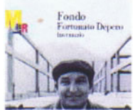
L'inventario: Depero in copertina

Sabato 17 gennaio riapre al pubblico, dopo attento restauro diretto da Renato Rizi, la Casa d'Arte Futurista Depero. È il primo e unico museo futurista d'Italia, nato da una originale visione di Fortunato Depero che lo aprì nell'agosto 1959. La casa-museo torlo-dievale, già sede del Banco di Pegni, è di fronte alla scalinata dell'antico Castello. Nel 1989, il Museo Depero divenne parte integrante del Mart di Trento e Rovereto, che ne custodisce i 3.000 oggetti fra dipinti, disegni, tarsie in panno e in "buxus", collages, manifesti, locandine, mobili, giocattoli. Grazie all'acquisizione dell'adiacente Casa Cadini, che permette l'ingresso da via Portici, il museo si avvale di 300 mq di esposizione permanente (più guardaroba, bookshop, caffetteria) dove trovano ottima-